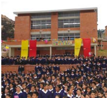
Colegio Ofelia Uribe de Acosta, Localidad de Usme

El programa de construcciones escolares le ha permitido a Bogotá crear en total 171.580 nuevos cupos: 119.540 mediante construcción de colegios nuevos, 24.960 por reforzamiento y mejoramiento de los colegios distritales antiguos y 23.080 por ampliación de los colegios. Como resultado del esfuerzo anterior, la matrícula oficial creció en un 17.4% entre el año 2003 y el 2007. En estas condiciones, la educación pública pasó de representar el 55.7% de la matrícula en 2003, al 62.5% en 2007.