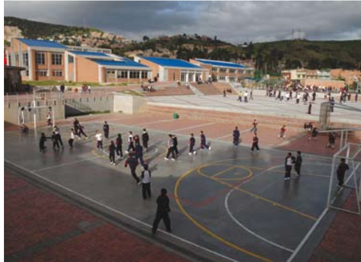
Colegio Enrique Olaya Herrera, Localidad Rafael Uribe Uribe

El colegio como escenario principal de la política educativa. El objetivo general y los objetivos específicos de la política educativa de Bogotá, se han de lograr en el escenario institucional de la educación, es decir, en los colegios. Para hacer viable el cumplimiento de la política educativa y de sus principios se requiere el compromiso de los directivos docentes, docentes, estudiantes y padre de familia en cada uno de los colegios oficiales de la ciudad.