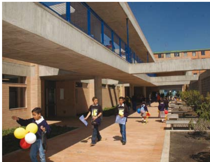
Colegio Gabriel Betancourt Mejía, Localidad de Kennedy

En el año 2005 la Secretaría de Educación estableció la gratuidad. Actualmente se benefician 607.262 con gratuidad total y 40.611 parcialmente. La gratuidad, la alimentación escolar, el transporte escolar, la entrega de útiles escolares, salud al colegio y la entrega de subsidios a la permanencia y de transporte tienen impacto positivo en los ingresos y en la calidad de vida de las familias. En el año 2012 toda la educación preescolar, básica y media será gratuita en la educación oficial.